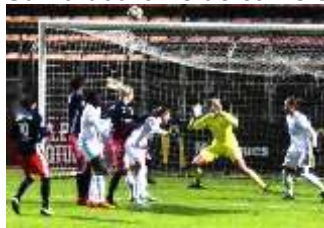
ADA (55'), corner de Amel

Sur la douzaine de corners qui se sont enchaînés, 3 seront décisifs.