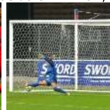
SAKI (p) (67')