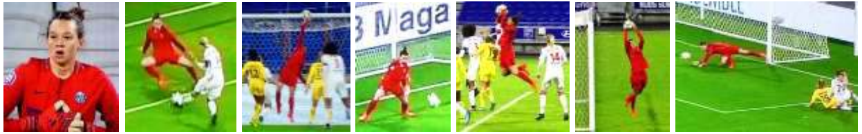
(1') ... (26') (32') (41') ... (61') (88')

L'action du match : Rush de DELPHINE sur 60 m, conclue par une frappe croisée stoppée par Endler.