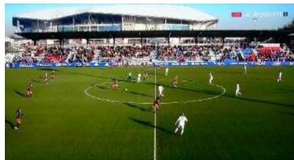
OL - Montpellier