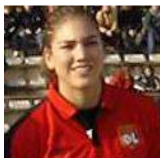
Hope SOLO Gardiennne (2005) 11 matchs

A cette époque, il avait procédé au recrutement de 5 joueuses de la sélection américaine au mercato hivernal lors de la saison 2004-2005.