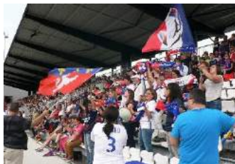
OL - Albi

Par contre quelle déception de voir le match contre Montpellier se disputer devant à peine 1269 spectateurs, bien loin des affluences des années précédentes, alors que l'affiche s'annonçait encore plus prometteuse. Manque de publicité par crainte de ne pouvoir accueillir tout le monde ?