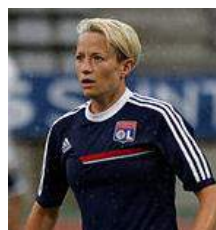
Megan RAPINOE Milieu de terrain (2013-2014) 29 matchs / 8 buts