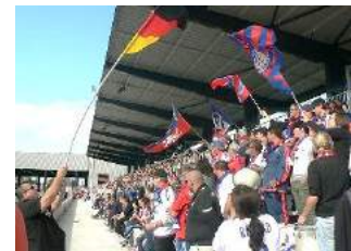
OL - Bordeaux

Qu'en sera-t-il à l'avenir de ces matches pour lesquels le Groupama Training Center est trop petit, et le Parc OL trop grand et coûteux ?